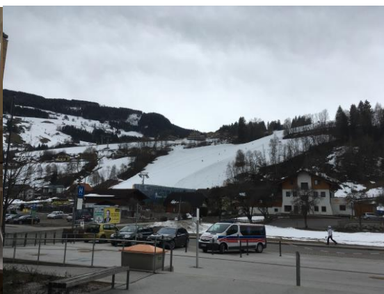
Blick vom Krankenhaus auf die Skipiste